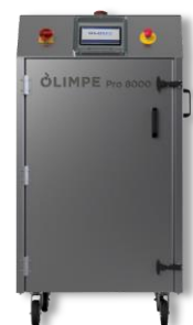
Solution caisson inox