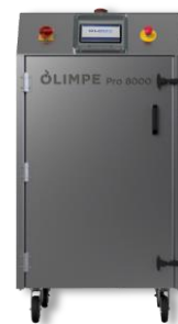
Solution caisson inox