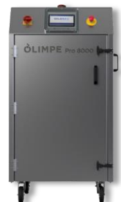
Solution caisson inox